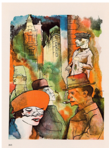
George Grosz, Dämmerung, 1922, Offsetsdruck nach Mappe „Ecce homo“

Die Ausstellung nimmt die politischen, gesellschaftlichen und ästhetischen Parallelen und Differenzen zwischen den beiden Künstlern in den Blick. Wenngleich unsere Gegenwart nicht eins zu eins mit den bewegten Weimarer Jahren vergleichbar ist, so erscheint der Zeitpunkt doch passend, noch einmal durch die Werke des Beobachters Grosz auf das Jahrhundert zweier Weltkriege und des aufkommenden Faschismus zu blicken. Die Ausstellung widmet sich allgegenwärtigen Fragen nach sozialer Verantwortung, Wahrnehmung von Krisen und Formen des künstlerischen Protests und fokussiert damit ein Grundgefühl der heutigen Zeit: Das Nebeneinander von Krieg und Alltagsfreuden, von Belastung und Konsum, von gesellschaftlicher Zerrissenheit und ästhetischer Überwältigung.