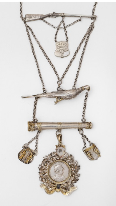
Schützenkette, 16. bis 20. Jahrhundert, Silber, teilw. vergoldet, Leihgabe Bürgerschützenverein 1826 e.V., Foto: Heinz Feußner